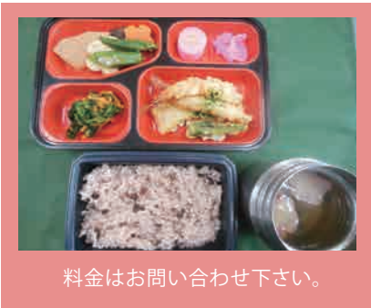
料金はお問い合わせ下さい。

お弁当を手渡しする事で、在宅高齢者の安否確認を兼ねたサービスを行っています。ご家族が心配される独居の方、体調不安な方などの食事摂取状況を聞き取り安否確認をします。通常の食事以外にも敬老の日など特別な日の食事も出しています。