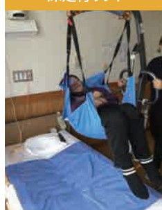
サンリフトミディ